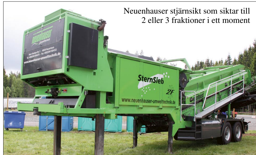
Neuenhauser stjärnsikt som siktar till 2 eller 3 fraktioner i ett moment